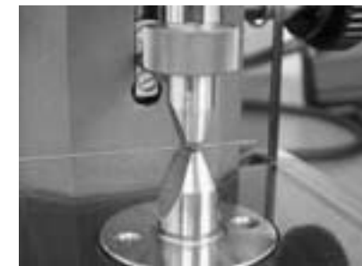
■超精密測長器 （測定精度0.01μm）