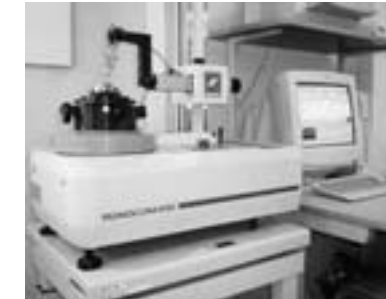
■超精密真円度測定器 （測定精度0.01μm）