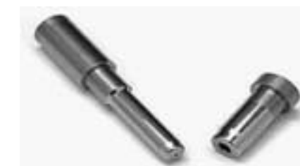
■エアニングパンチ・ダイ