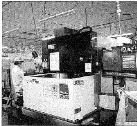
「M500S」でさらに付加価値の高い仕事を取り込んでいく

いるワークスは、遠賀川の流域、福岡県遠賀町に本社・工場を置く。創業は平成3年、今でこそ「元気なモノづくり中小企業300社」(平成21年)に選定されるなど精密金型部品メーカーとして名を馳せているが、当初は北九州市で研削関連の機械工具商としてのスタートだった。